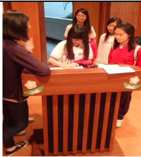
性平心靈影展【戀愛恐慌症】簽到