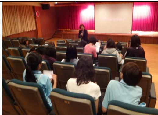
性別心靈影展【戀愛恐慌症】學生分享影片心得