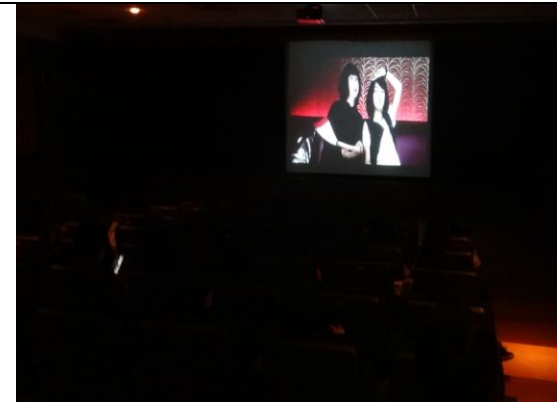
性平心靈影展【戀愛恐慌症】影片觀賞