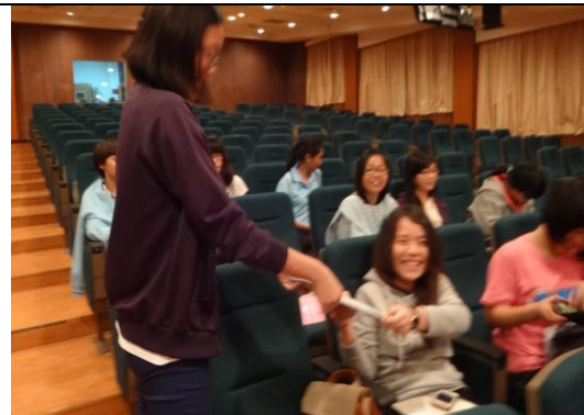
性別心靈影展【戀愛恐慌症】有獎徵答