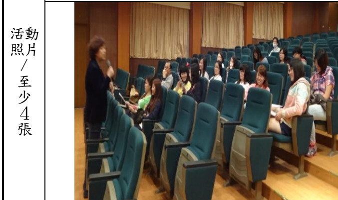
性平心靈影展【戀愛恐慌症】影片導覽