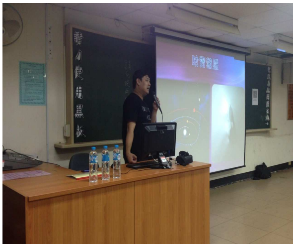
【老師介紹星空之美】