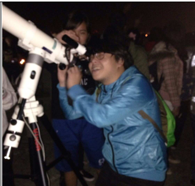
【天臺架設望遠鏡供同學觀星】