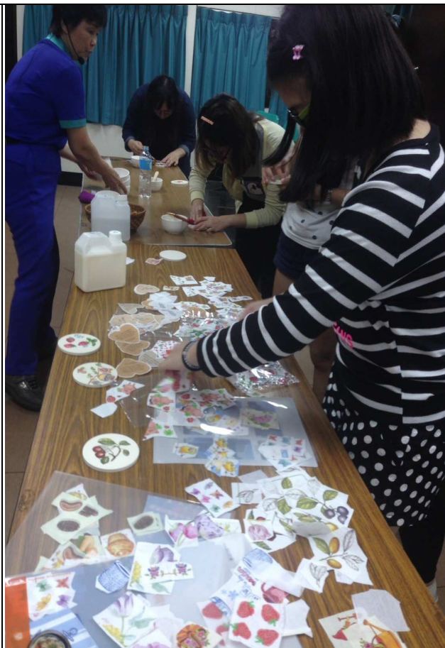
【選擇自己喜歡的素材】