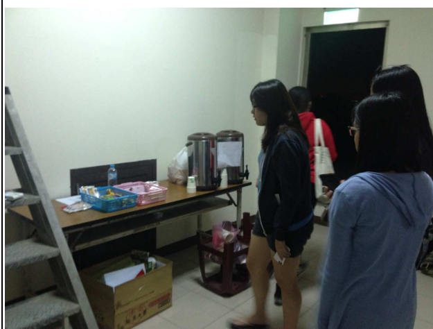
【現場提供沖泡飲料、餅乾】