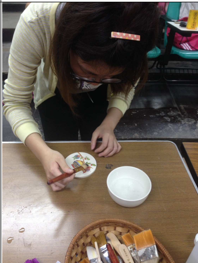
【創造屬於自己的蝶谷巴特杯墊】