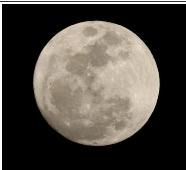
【天臺觀星由天文望遠鏡看到的月亮】