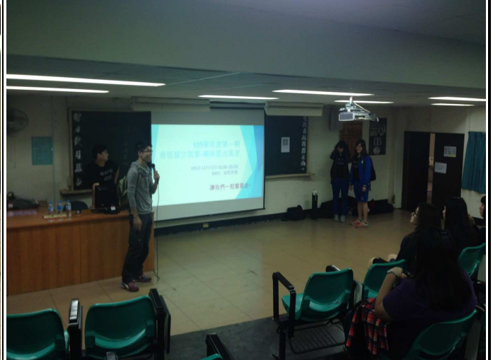
【助教及協助儀器架設的同學】