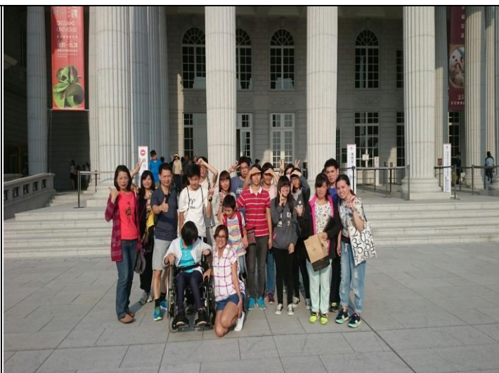
【奇美博物館大合照】