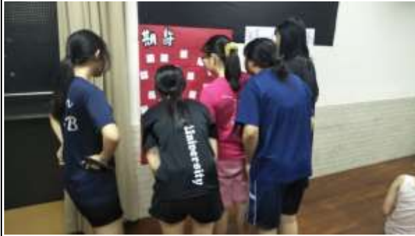
【觀看祈福卡片海報】