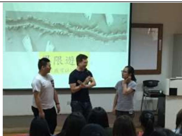
【生理異性對於界限遊戲的感想】