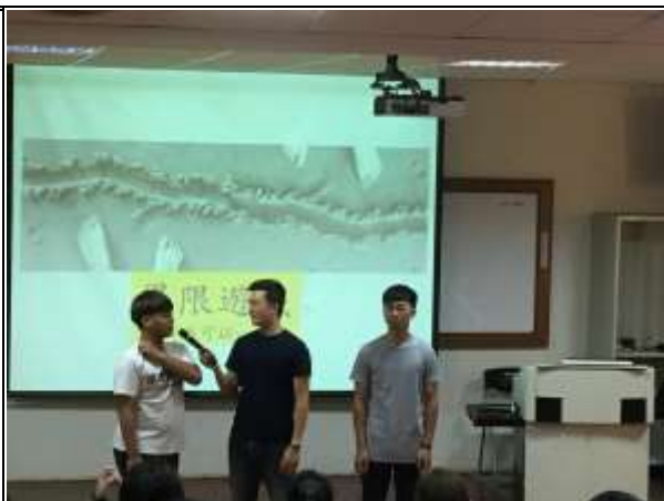
【生理同性對於界限遊戲的感想】