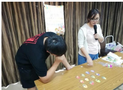
【成員認真地挑戰遊戲的模樣】