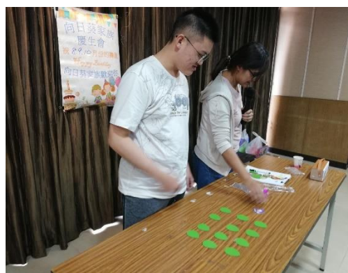
【成員們挑戰記憶力遊戲】