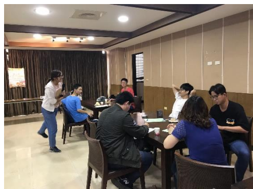
【成員們開心地玩終極密碼遊戲】