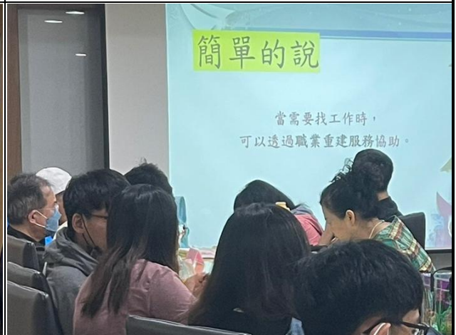
【輔導員與導師及學生進行畢業生轉銜討論】