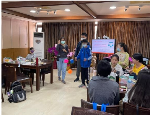
【成員們開心地玩小遊戲】