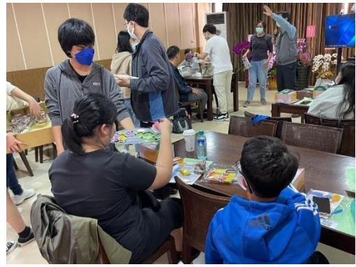
【成員間一起分享小餅乾】