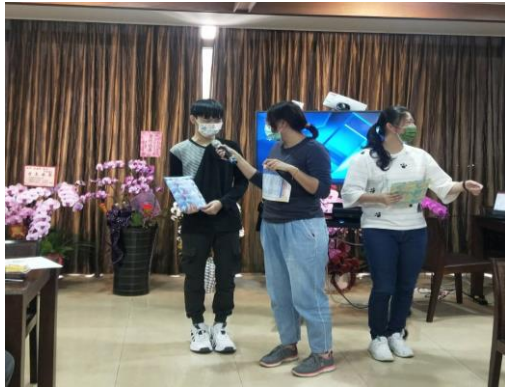
【壽星分享自己的心願】