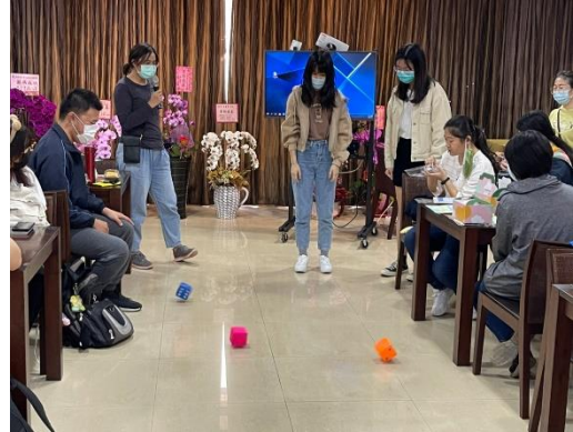
【成員們開心地玩小遊戲】