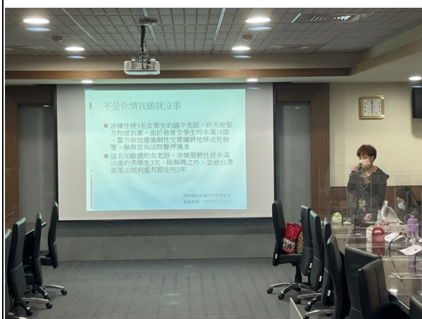
【特殊教育學生性平教育宣導】