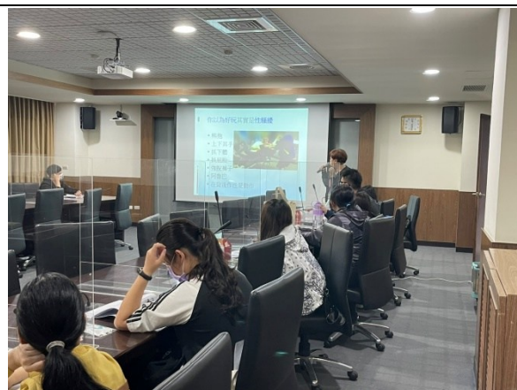
【特殊教育學生性平教育宣導】