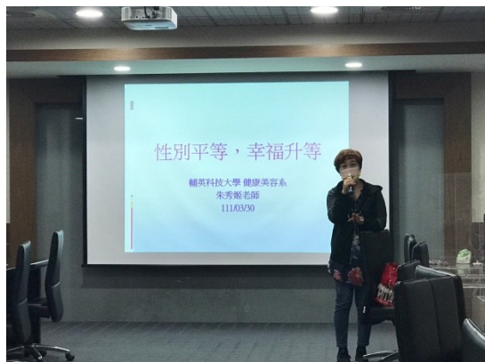
【特殊教育學生性平教育宣導】