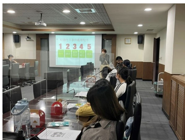
【特殊教育學生性平教育宣導】