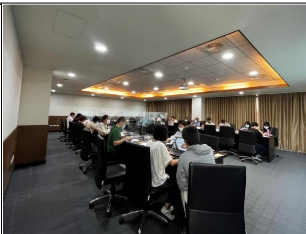
【委員閱讀會議資料】