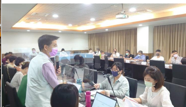
【諮商中心主任進行提案說明】