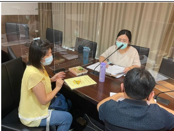
【輔導員與導師、前階段老師進行新生轉銜】