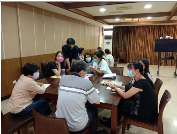
【輔導員與系主任、導師、家長、學生、院系心理師進行討論】