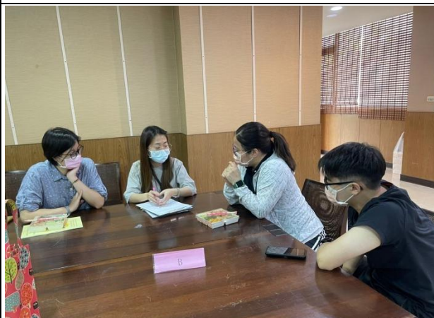
【輔導員與導師、家長、學生進行討論】