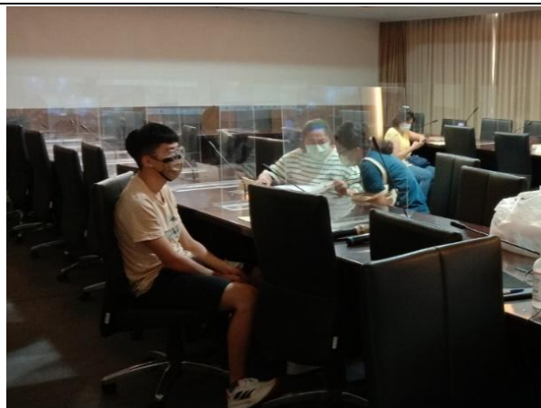
【輔導員與導師、學生進行討論】