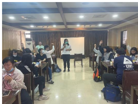
【大家一起開心玩賓果遊戲】