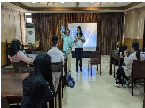
【大家一起討論播放的影片】