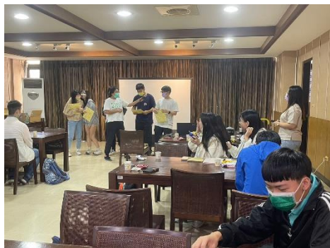
【壽星分享自己的願望】