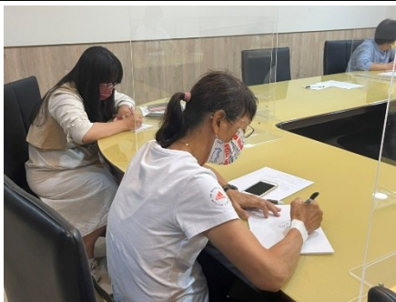
【第二場次研習-纏繞畫體驗】