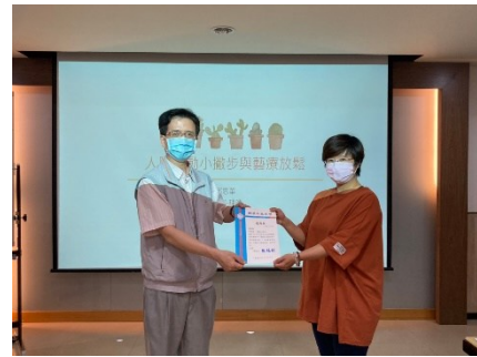
【第二場次研習-頒發感謝狀】