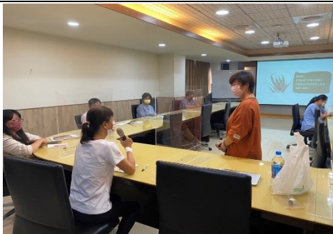
【第二場次研習-講師邀請在場老師分享協助學生之經驗】