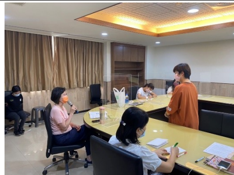
【第二場次研習-活動結束老師回饋】