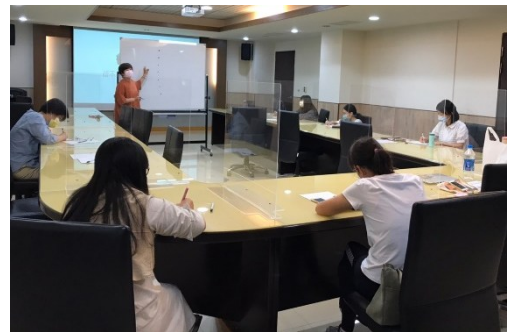
【第二場次研習-纏繞畫體驗】