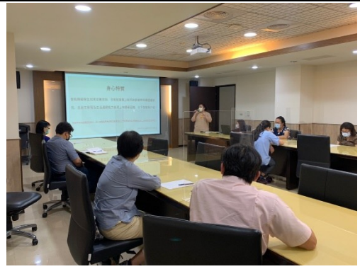
【第一場次-輔導員進行特殊教育學生特質說明會(智能障礙類別)】