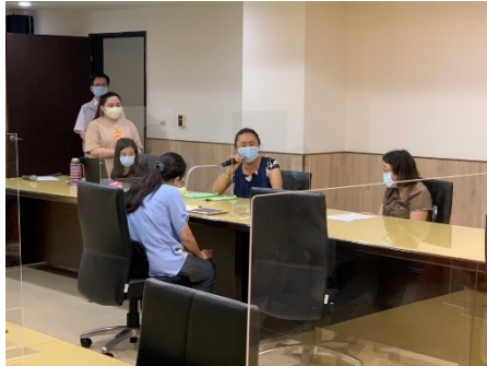
【第一場次-老師分享】