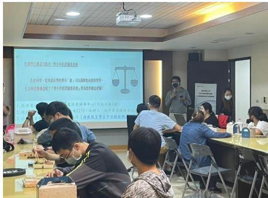
【中心學務輔導人員進行學生申訴宣導】