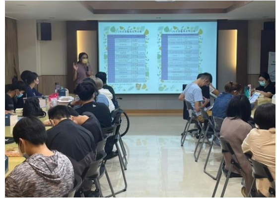
【輔導員介紹資源教室服務與活動】