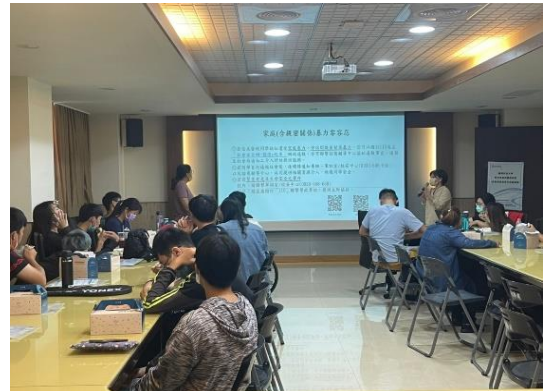
【中心社工師進行家暴及跟騷法宣導】