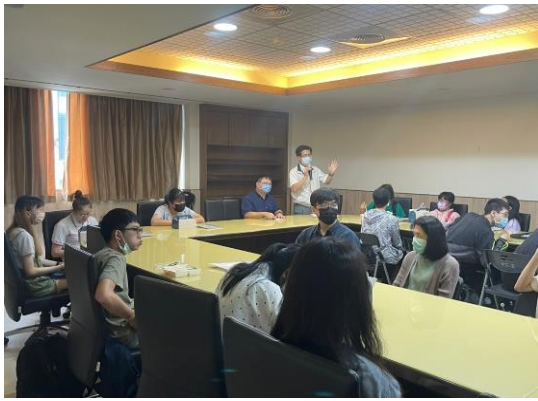
【楊主任致詞並給予學生祝福】