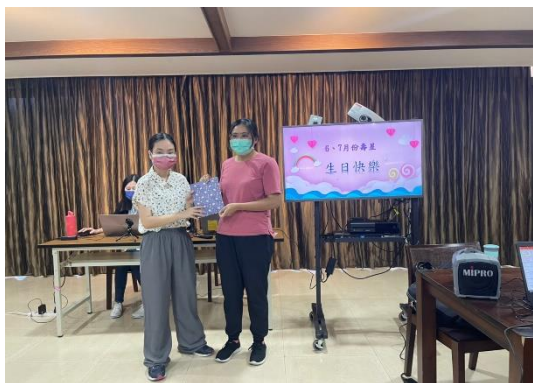
【頒贈小禮物給壽星】