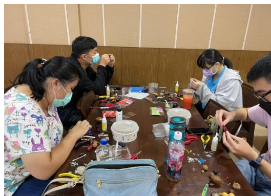
【學生認真手作種子吊飾】