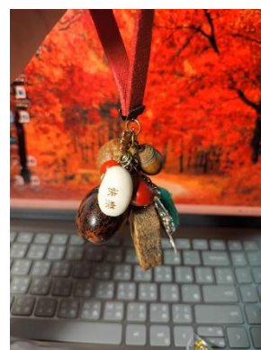
【線上同學分享自己的作品】