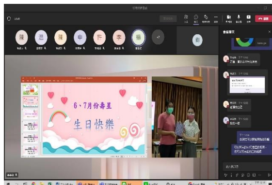
【與線上同學一起給與壽星祝福】