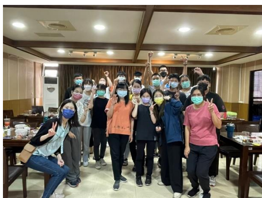
【大家開心拿著自己作品合影】