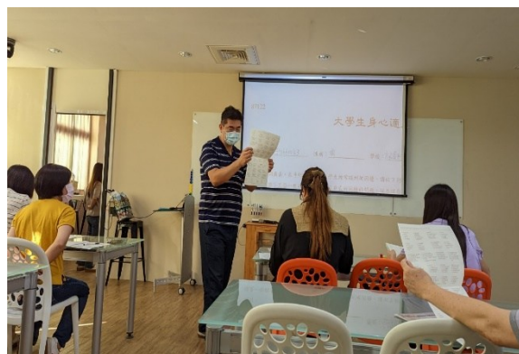
【第二場次研習-講師講授測驗量表】