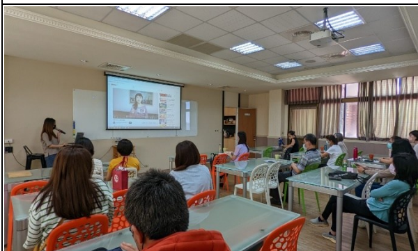
【第一場次-輔導員進行特殊教育學生特質說明會(情緒行為障礙類別)】