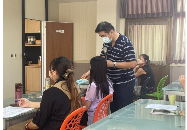
【第二場次研習-老師回饋，並送小禮物】