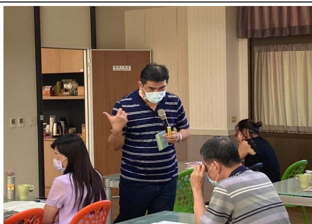
【第二場次研習-老師回饋，並送小禮物】