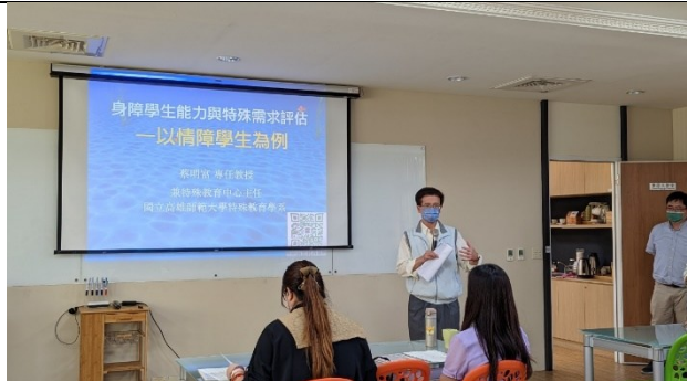
【楊主任進行活動說明】