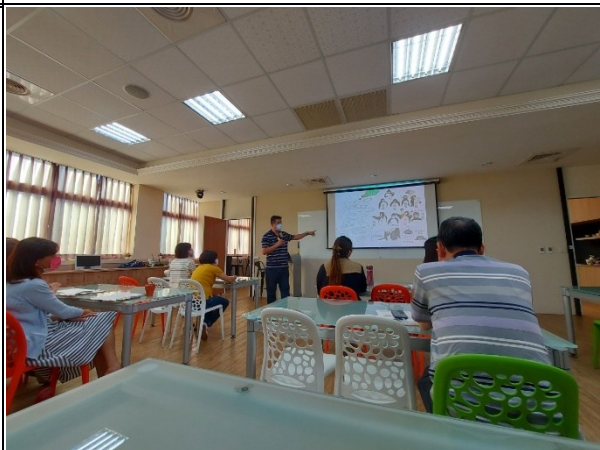
【第二場次研習-說明情緒障礙之類型】