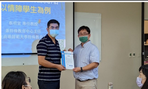
【副學務長頒發感謝狀】