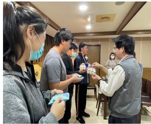
【主任頒贈小禮物給壽星】