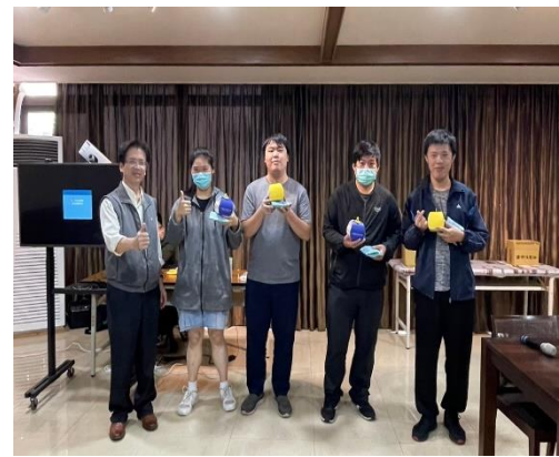
【主任和壽星一起合影】