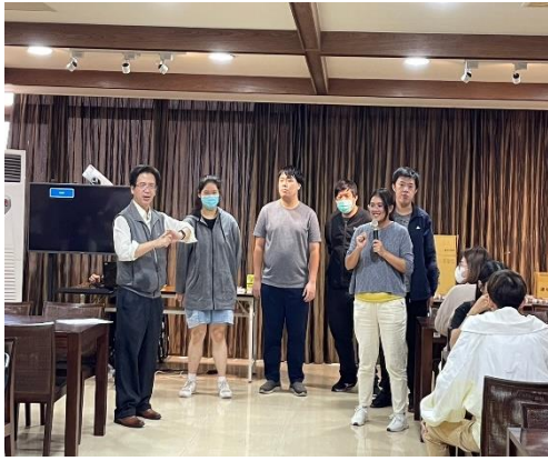
【壽星接受大家的祝福】