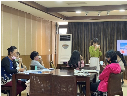
【第二場次研習-精油冥想】