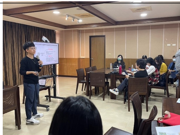
【第一場次-輔導員分享面對肢體障礙學生可提供哪些協助措施】