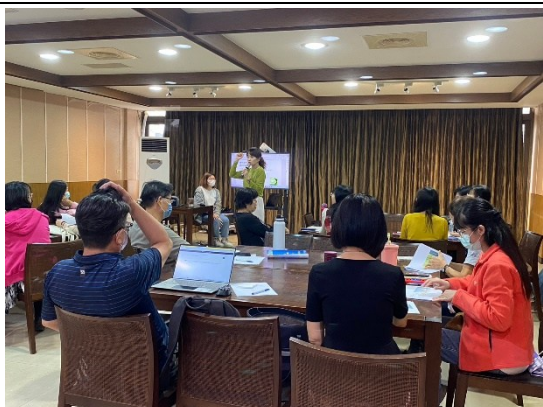
【第二場次研習-介紹精油】