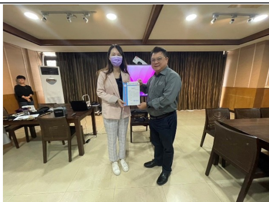
【第一場次-頒發傅家芸老師感謝狀】