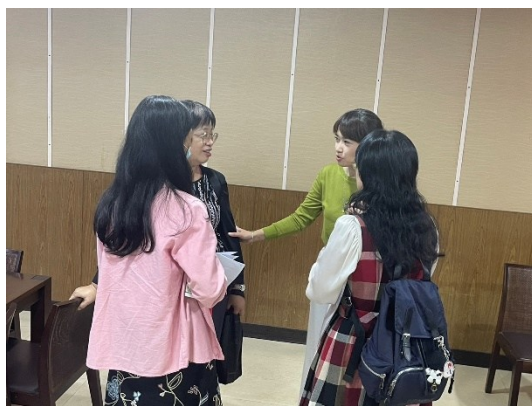
【第二場次研習-老師們互動及回饋】