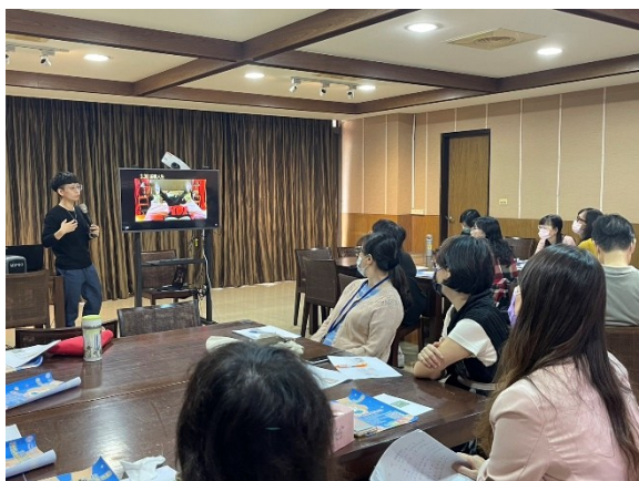
【第一場次-輔導員介紹肢體障礙相關電影】