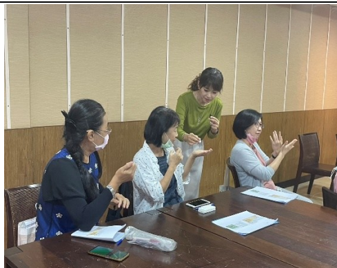
【第二場次研習-感受精油香氣、學習自我照顧方法】