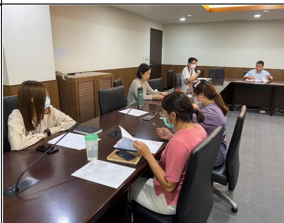
【評估小組成員針對學生狀況進行討論】