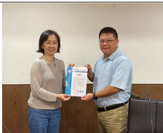
【學務長頒發感謝狀】