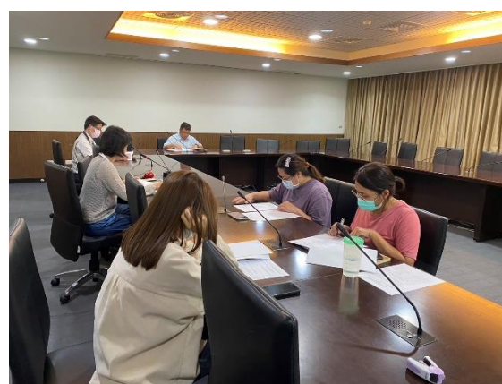
【評估小組成員針對學生狀況進行討論】