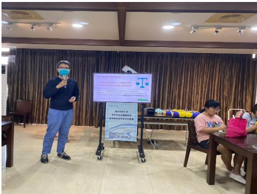
【中心學務輔導人員進行學生申訴宣導】