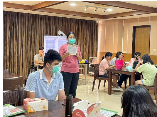
【輔導員介紹資源教室服務與活動】