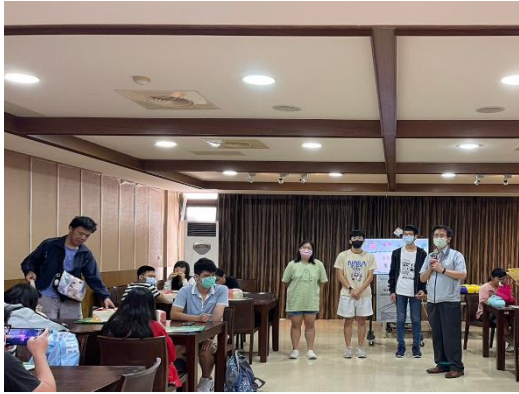
【楊主任致詞並給予學生祝福】