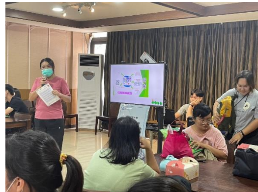
【輔導員自殺防治等宣導】