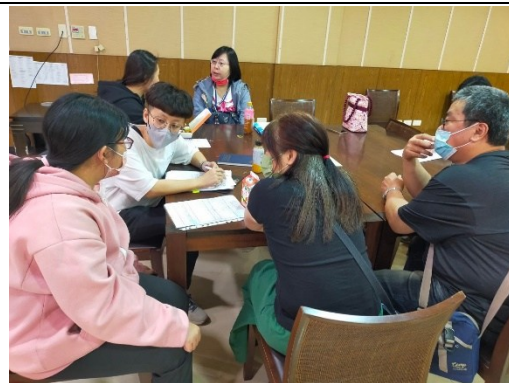
【護理學院-資源教室輔導員、老師、學生、家長進行討論】