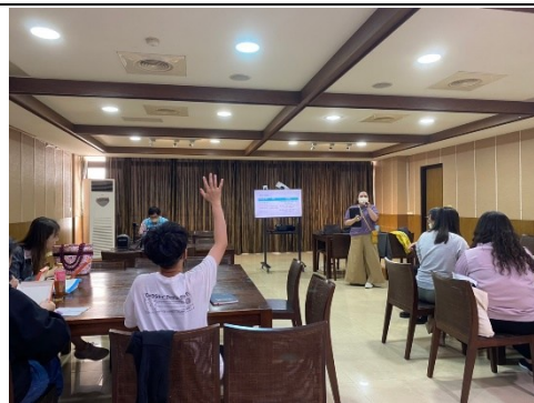
【輔導員介紹資源教室相關支持性服務】