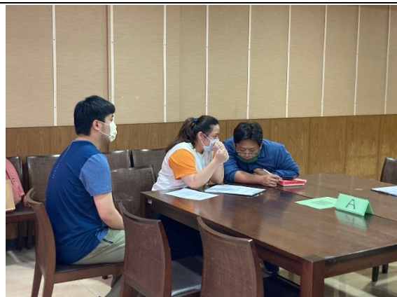
【環境與生命學院-資源教室輔導員、老師、學生進行討論】