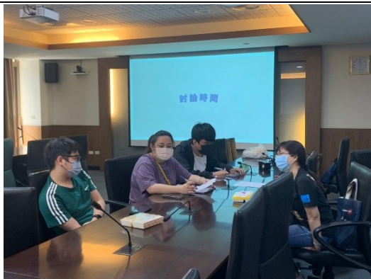
【護理學院-資源教室輔導員、老師、學生、家長、院系心理師進行討論】