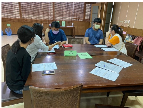
【環境與生命學院-資源教室輔導員、老師、學生、院系心理師進行討論】