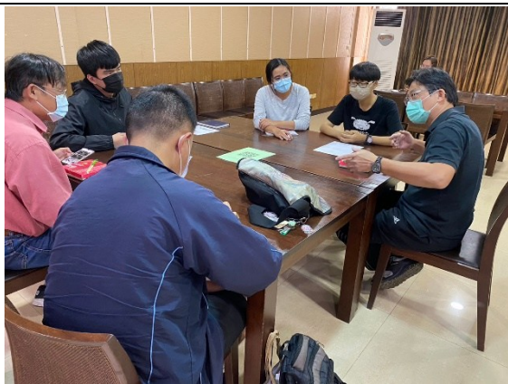
【醫學與健康學院-資源教室輔導員、老師、學生進行討論】