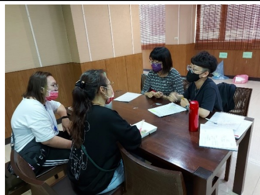
【人文與管理學院-資源教室輔導員、學生、家長、院系心理師進行討論】