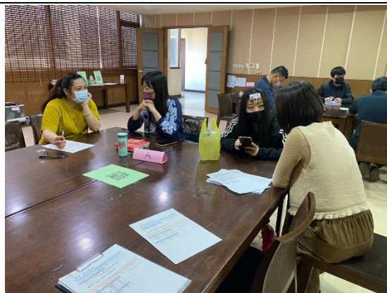
【醫學與健康學院-資源教室輔導員、老師、學生、家長、院系心理師進行討論】