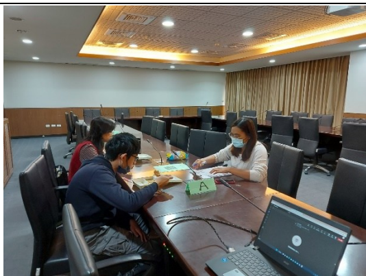
【人文與管理學院-資源教室輔導員、老師、學生進行討論】