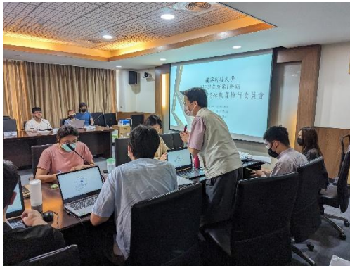
【諮商中心主任進行提案說明】