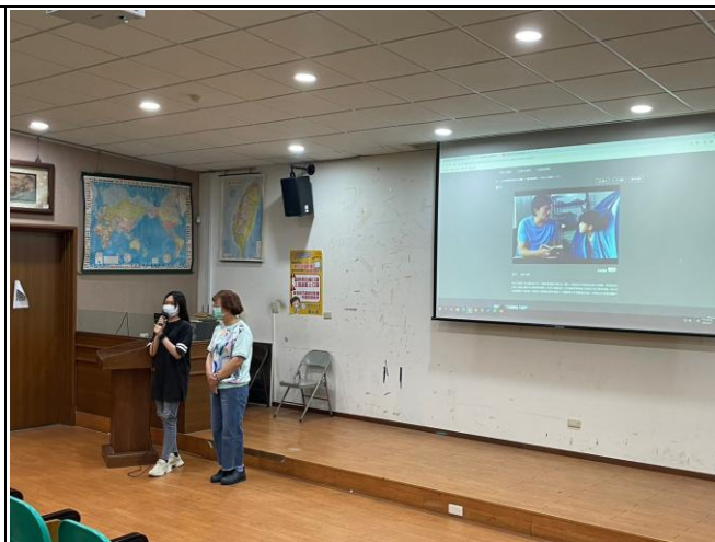
【資源教室輔導員與同學進行特教宣導】