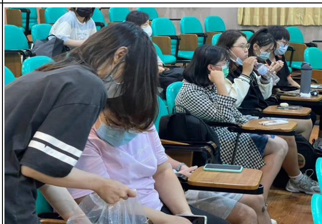
【同學領取有獎徵答禮品】