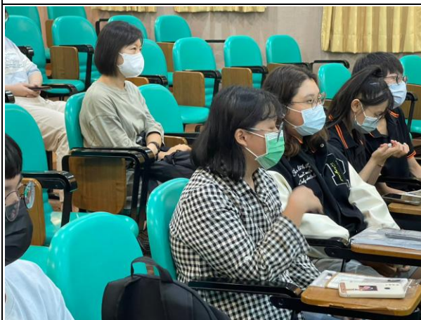
【同學分享影後學習及心得】