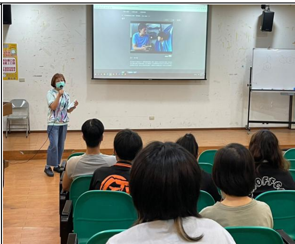
【老師與同學進行電影賞析】