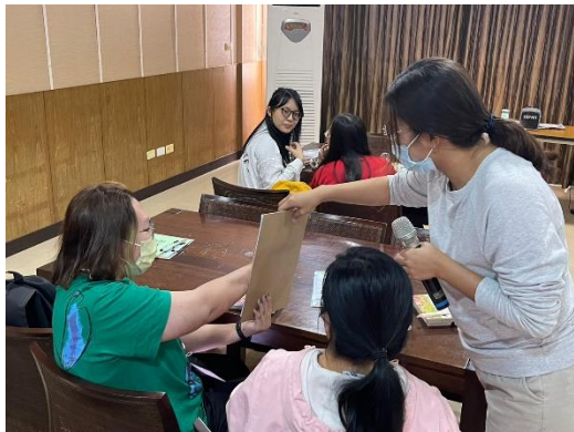
【大家一起玩終極密碼活動】