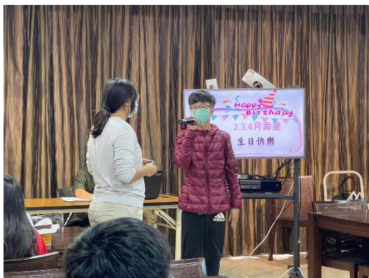
【壽星分享自己的願望】