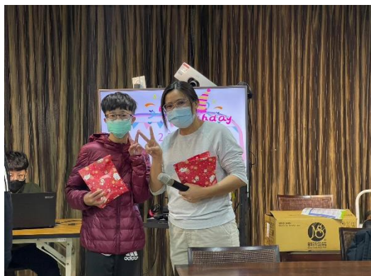
【輔導員給予壽星祝福】