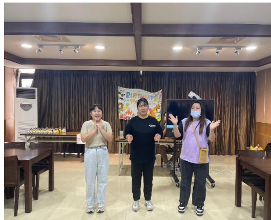
【壽星接受大家祝福】