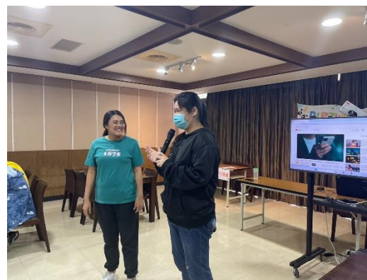
【學生上台給予壽星祝福】