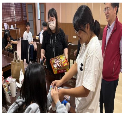
【主任與大家開心同樂】