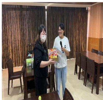
【輔導員講解活動內容】