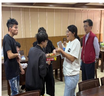
【主任與大家開心同樂】