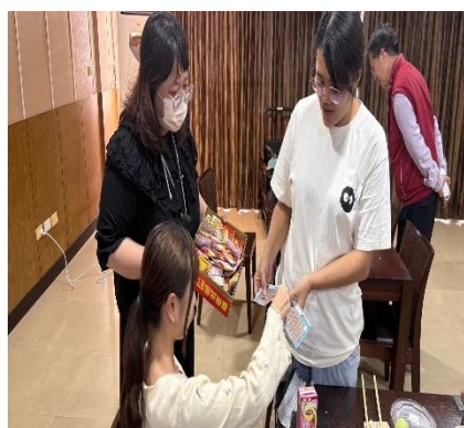
【大家開心地玩抽抽樂遊戲】