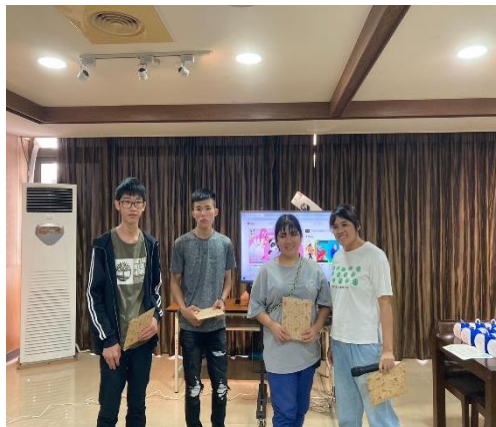
【壽星們接受大家的祝福】