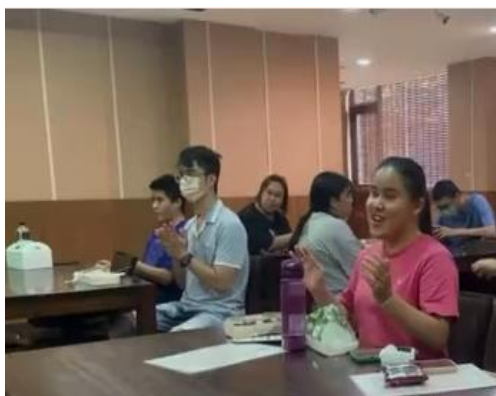
【大家開心地一起做律動】