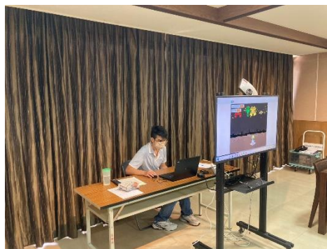
【大家開心玩射飛機小遊戲】