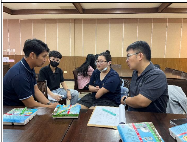
【輔導員與導師、前階段老師和新生 進行討論】