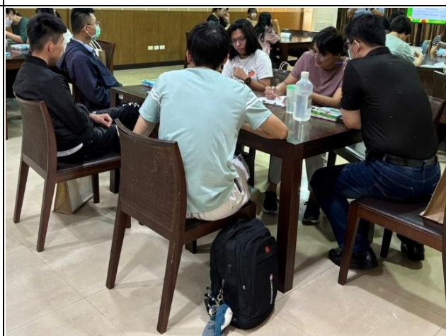
【輔導員與系主任、導師、院系心理師、學生 進行討論】