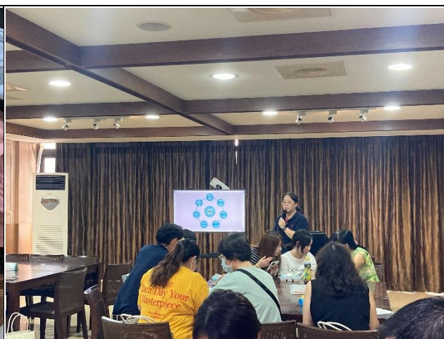
【輔導員說明新生轉銜服務】