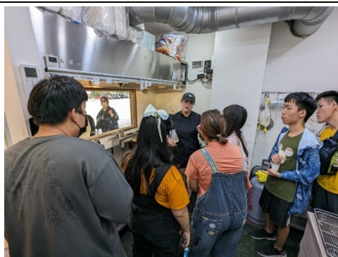
【參觀工作場域及分享工作實務經驗】