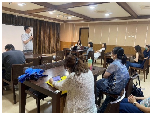
【第一場次-老師現場回饋、諮商輔導中心楊主任分享學生輔導處遇經驗】