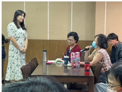
【第二場次研習-現場老師回饋】