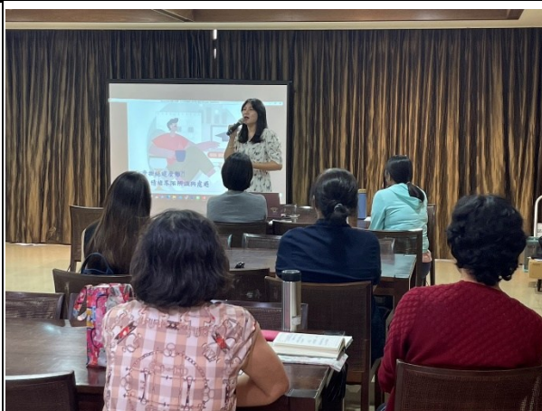
【第二場次研習-介紹情緒行為障礙特質】