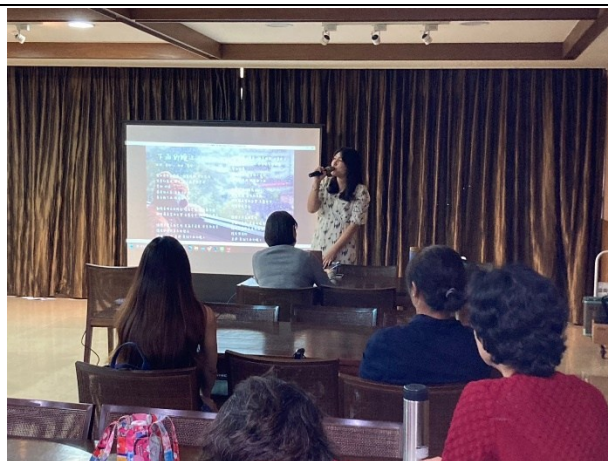
【第二場次研習-演場歌曲進行互動】