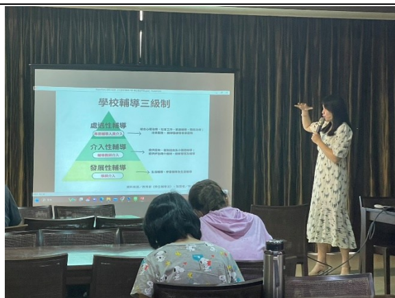
【第二場次研習-三級輔導機制】