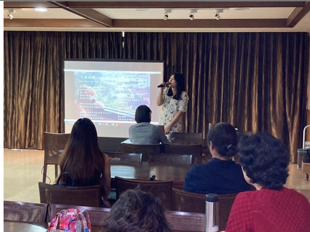
【第二場次研習-演場歌曲進行互動】