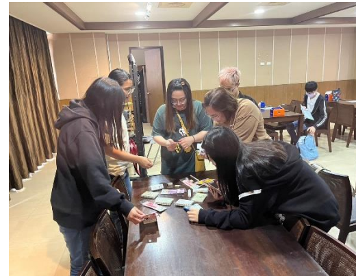
【大家選取玩遊戲獲獎的禮物】