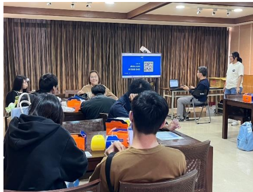
【大家等待玩線上小遊戲】