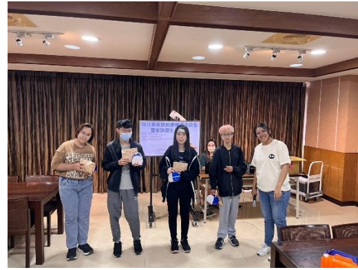
【壽星們接受大家祝福】