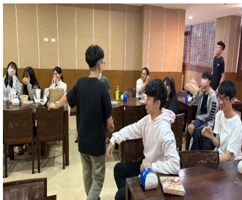
【大家開心地玩遊戲】