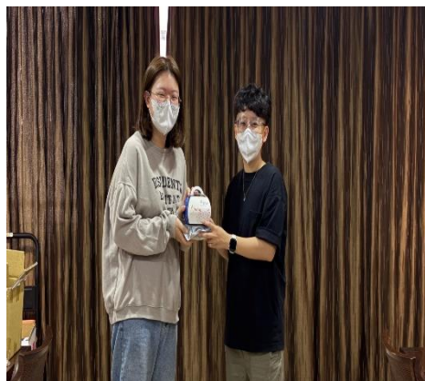
【壽星接受大家的祝福】