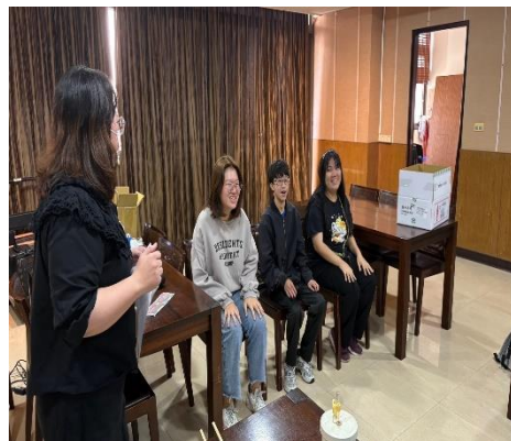
【大家開心地玩遊戲】