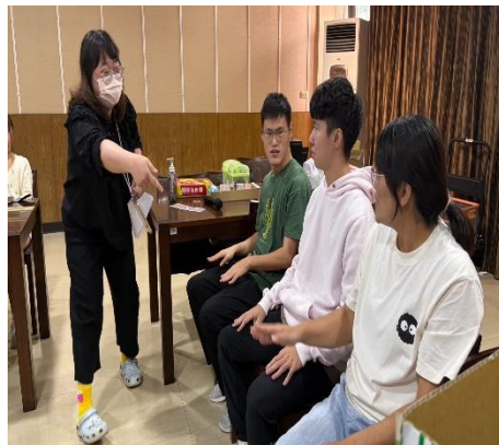
【輔導員與學生一起玩遊戲】