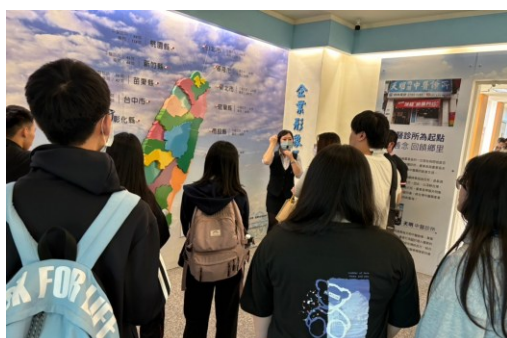
【導覽員為學生介紹公司經營理念】