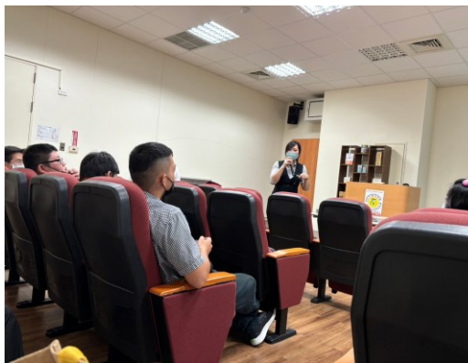
【導覽員在簡報過程中與學生 QA 互動時間】