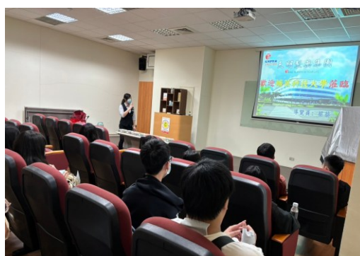
【導覽員為學生進行藥廠職業導向簡報】