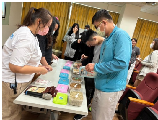
【足浴包製作與體驗】