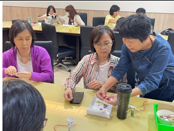
【第二場次研習-製作暖心花草茶】