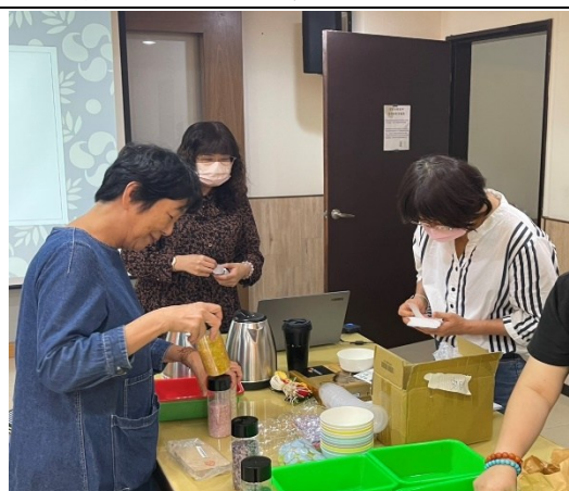
【第二場次研習-享用花草茶】