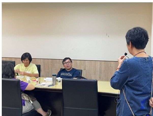
【第二場次研習-現場老師回饋】