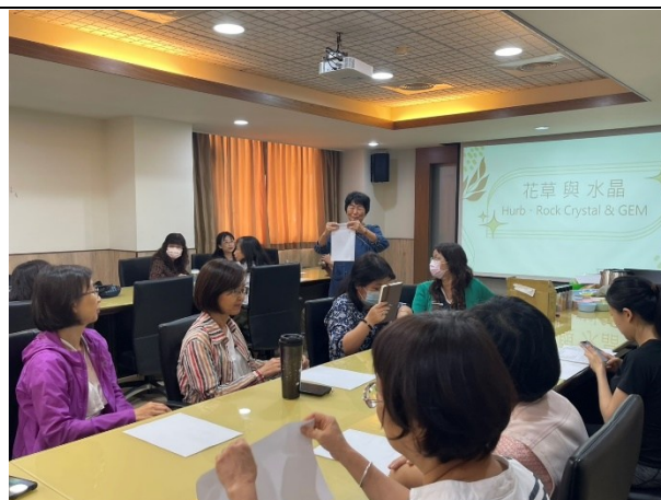
【第二場次研習-介紹園藝治療】