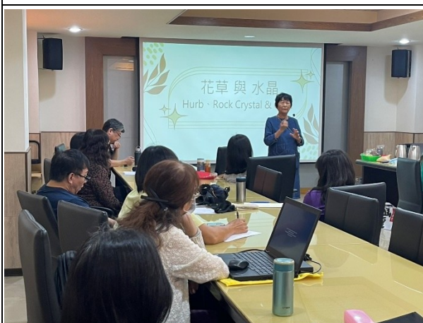
【第二場次研習-特殊教育學生之經驗分享】