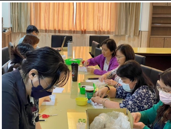
【第二場次研習-製作五色水晶瓶】