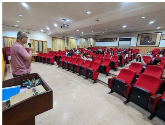
影片結束後講師分享及引導思考-2