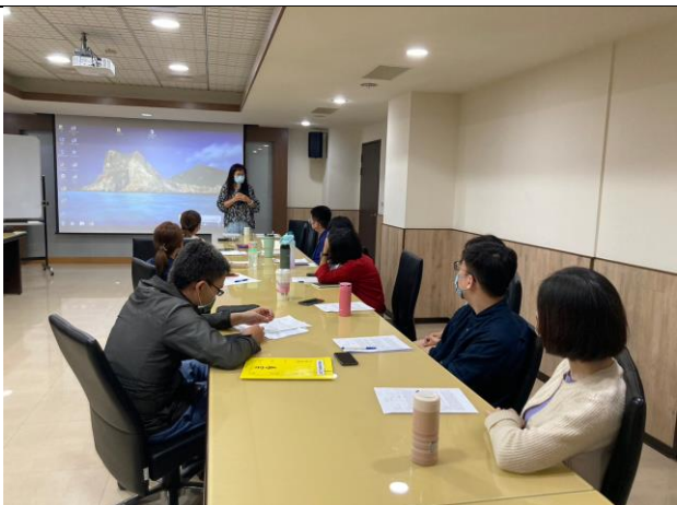
【與會輔導人員進行討論】