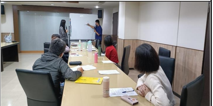
【丁原郁教授與社工師討論自殺風險辨識】