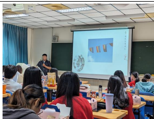
學生專注聆聽生命故事