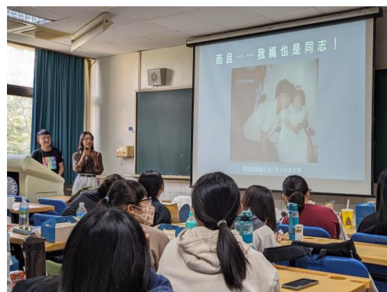
多元性別講者的生命故事分享