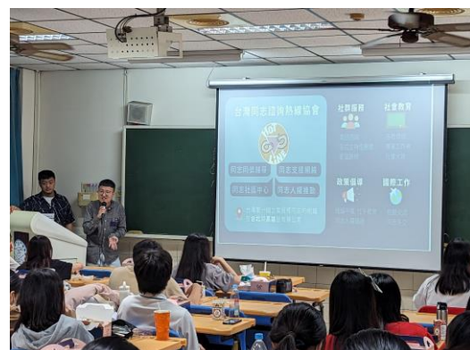
帶領同學認識同志熱線協會的服務及資源