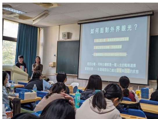
多元性別講者分享出櫃的經驗