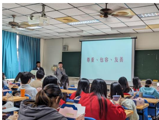
面對多元性別態度：尊重、包容、友善