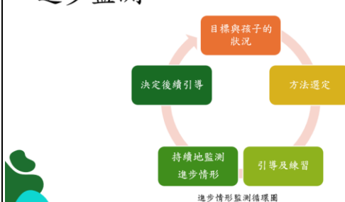
【講師分享與學生會談後的進步監測機制】