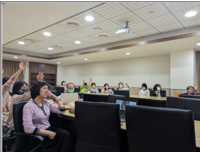
【老師們舉手回應講師的提問】