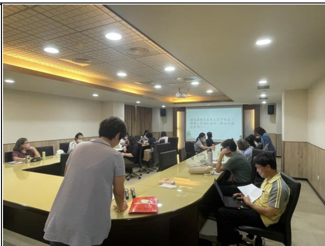
【講師帶領溝通技巧活動】