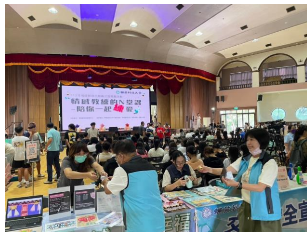
高雄市政府警察局林園分局參與擺攤宣導人身自我保護