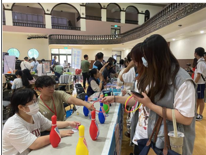
本校諮商輔導中心透過保齡球小遊戲，與學生一起打破關係中的瓶頸