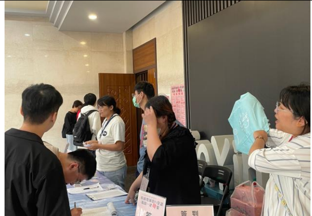
學生闖關完成兌換獨家發行的馬卡龍色潮流帆布袋，陪你隨身練愛