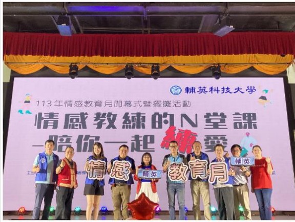
2024-10-16 輔英科大情感教育月 校長化身「情感教練」陪你一起練愛。