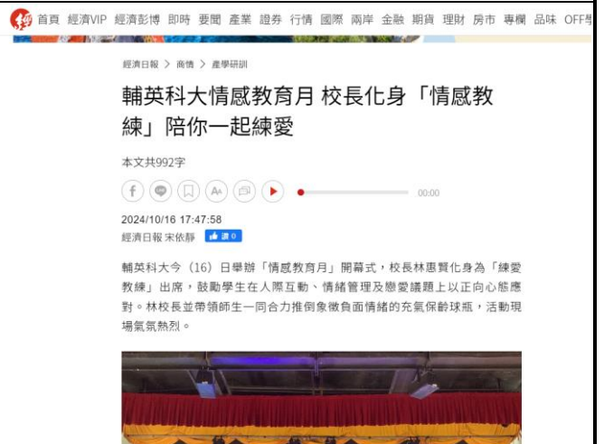
經濟日報-輔英科大情感教育月 校長化身「情感教練」陪你一起練愛