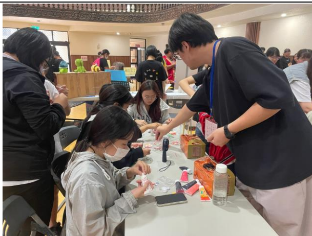
本校諮商輔導中心透過一起動手做「奶油膠」，讓友誼在創意中升溫