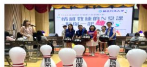
中聯新聞網報-輔英科大情感教育月 校長化身「情感教練」陪你一起練愛