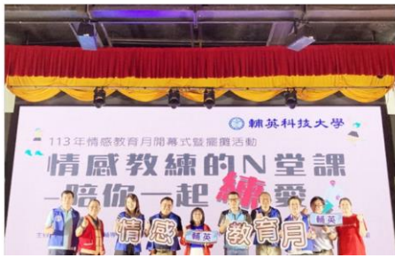
台灣新生報-輔英科大情感教育月開幕

今日 2024 年 10 月 22 日，農曆 九月二十日 登：國際 報社 作：陳 明 恩：安群 開市 修編 立碑