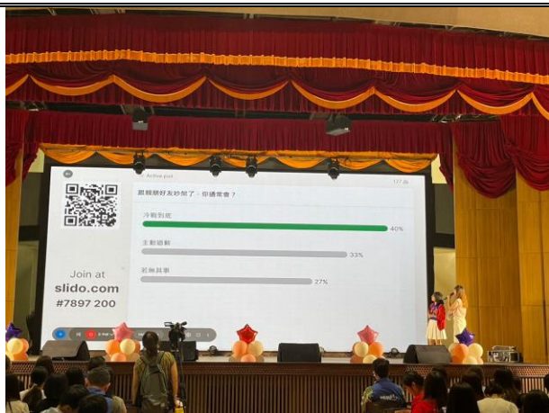
輔英即時練愛大搜查