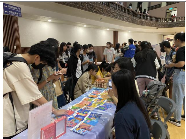
本校諮商輔導中心透過療癒牌卡與學生互動