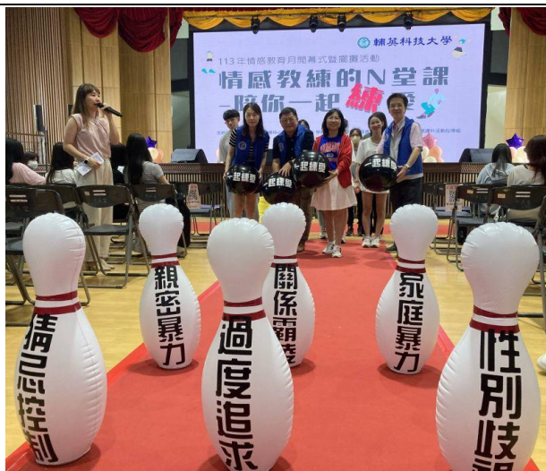
校內師生共同推倒象徵負面情緒的保齡球瓶