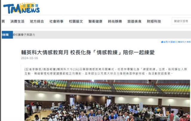
三星傳媒-輔英科大情感教育月 校長化身「情感教練」陪你一起練愛