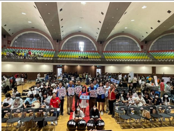
開幕儀式校內師生一同大合照