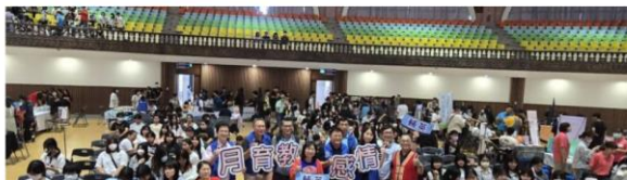
好報新聞網-輔英科大情感教育月 校長化身「情感教練」陪你一起練愛 輔英科大十六日舉辦情感教育月開幕