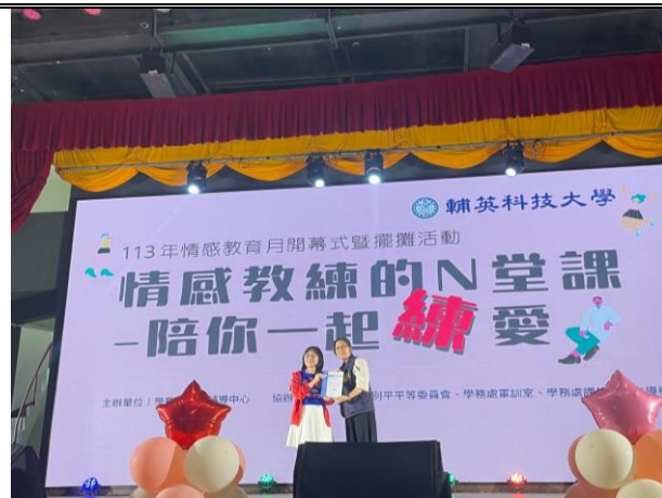
校長頒發感謝狀給高雄市政府警察局林園分局