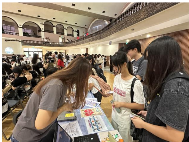
本校性平會攤位宣導性平相關知識