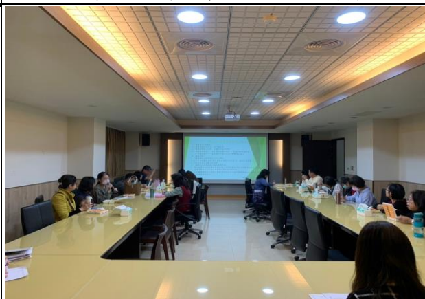
護理學院陳立庭心靈 SPA 導師分享輔導案例簡報