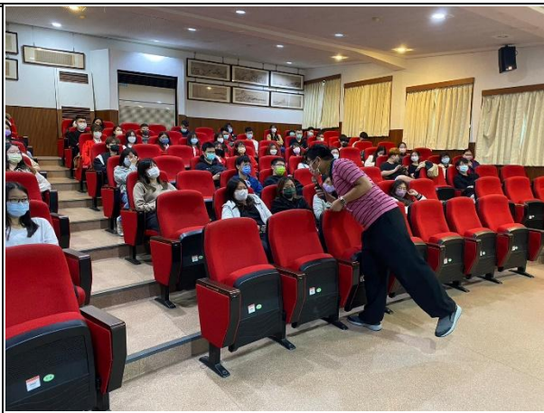
【(場次二)圍爸講師與學生互動1】