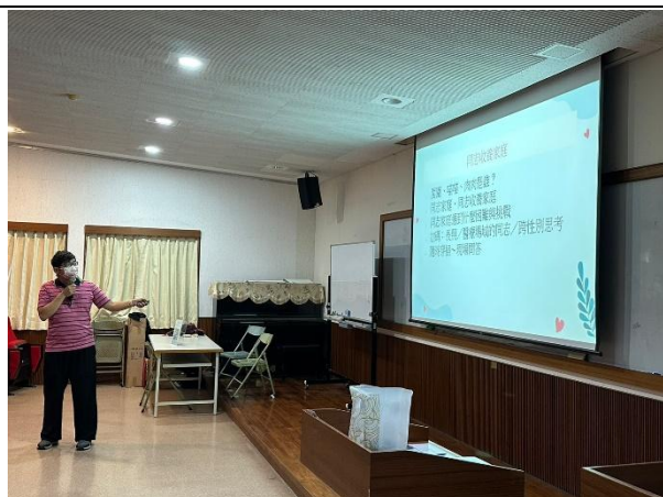
【(場次二)圍爸講師分享1】