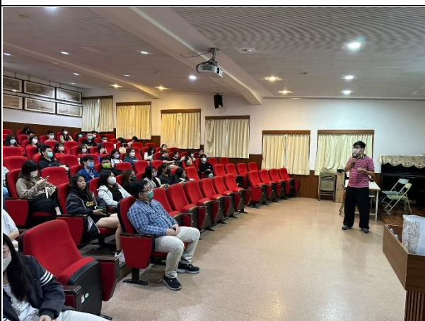
【(場次二)圍爸講師分享2】