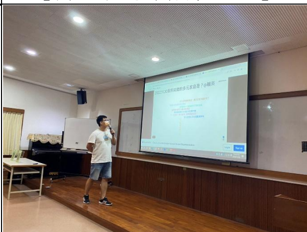
【(場次一)喵爸講師與學生互動與回饋1】