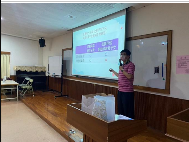
【(場次二)圍爸講師分享4】