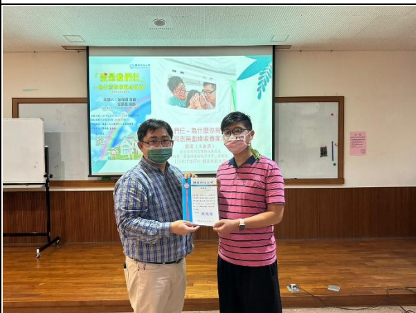
【(場次二)副學務長頒發感謝狀給圍爸】