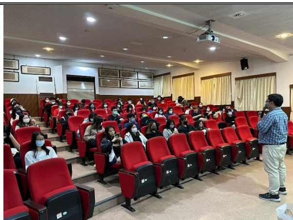
【(場次二)林副學務長致詞2】