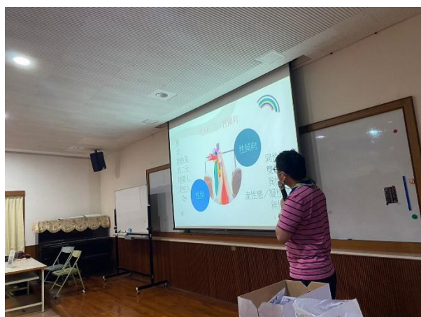
【(場次二)圍爸講師分享3】