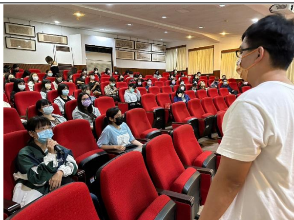
【(場次一)喵爸講師與學生互動1】