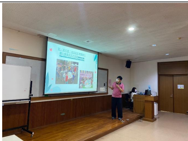
【(場次二)圍爸講師分享5】