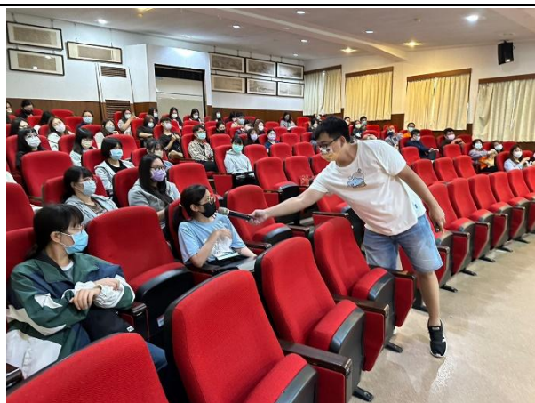
【(場次一)喵爸講師與學生互動3】