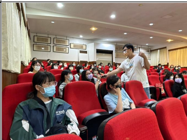
【(場次一)喵爸講師與學生互動2】