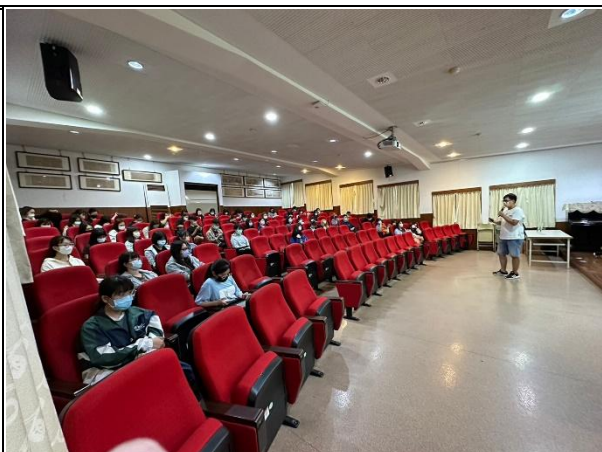
【(場次一)喵爸講師分享】