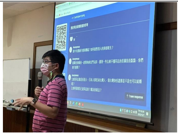
【(場次二)圍爸講師與學生互動1】