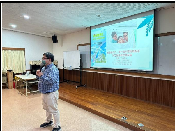
【(場次二)林副學務長致詞1】