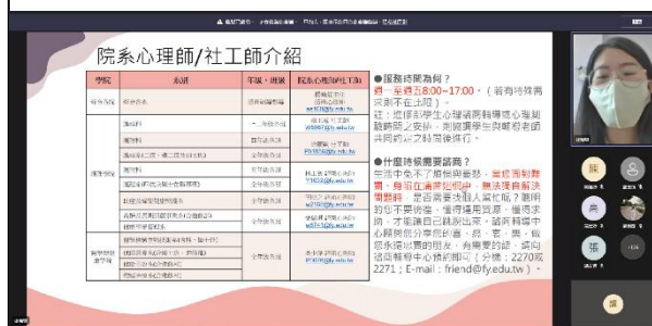
【線上直播說明輔導股長業務的畫面】