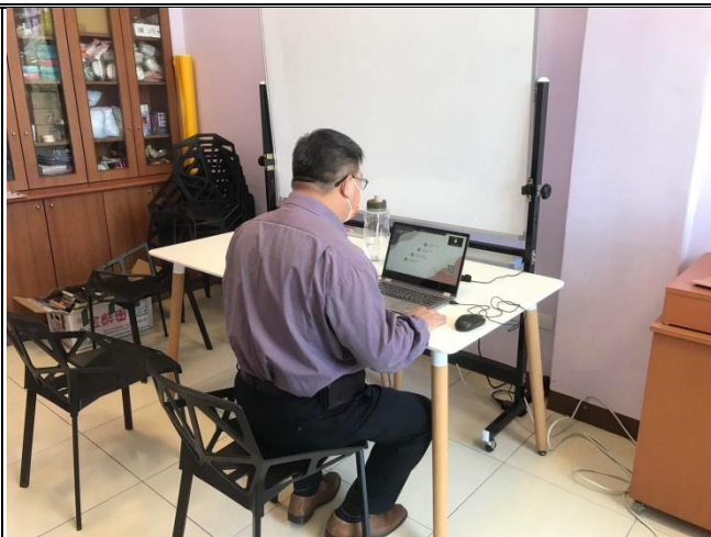
【學務長線上直播致詞】