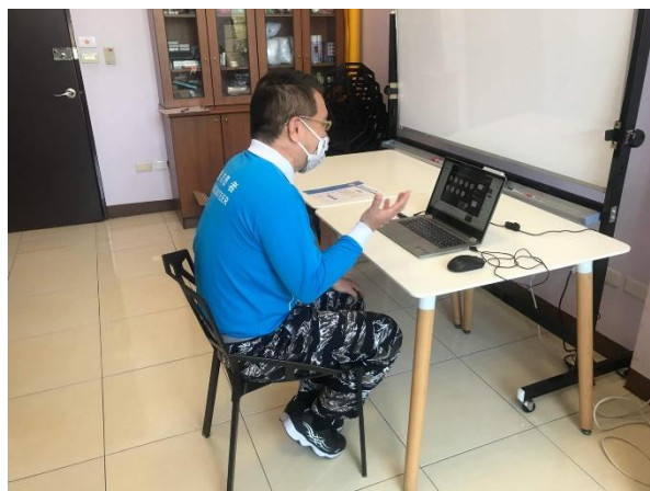
【講師線上直播課程】