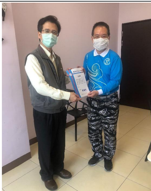
【線上直播頒發感謝狀】