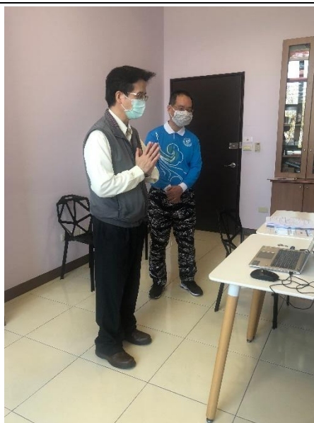
【主任線上直播致詞】