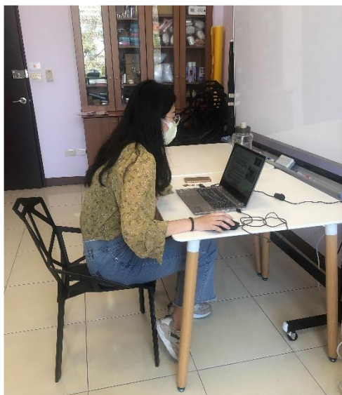
【線上直播說明輔導股長業務】