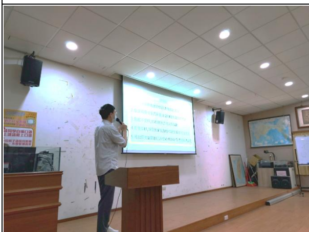
【講師與學生進行小測驗討論】