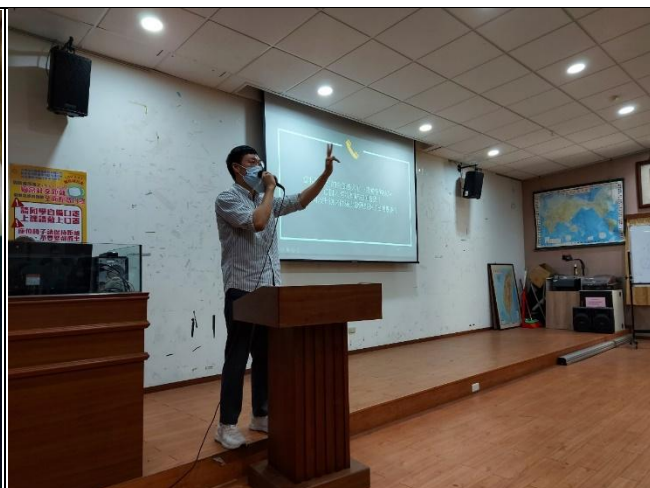
【講師進行電影賞析】