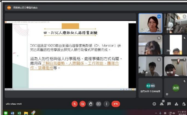
【DISC 人際取向人格特質測驗】