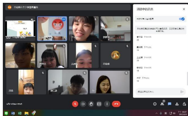
【學習帶團體活動及技巧演練】