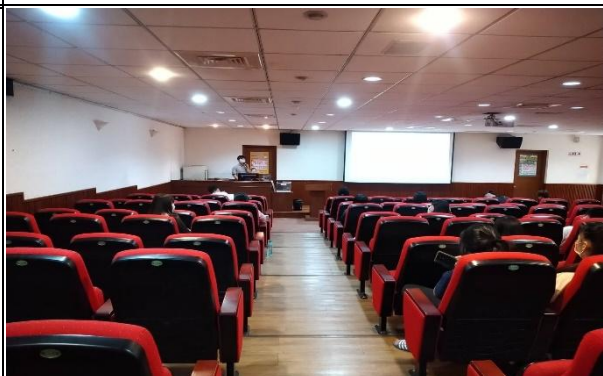
【陳醫師解說自殺防治步驟】