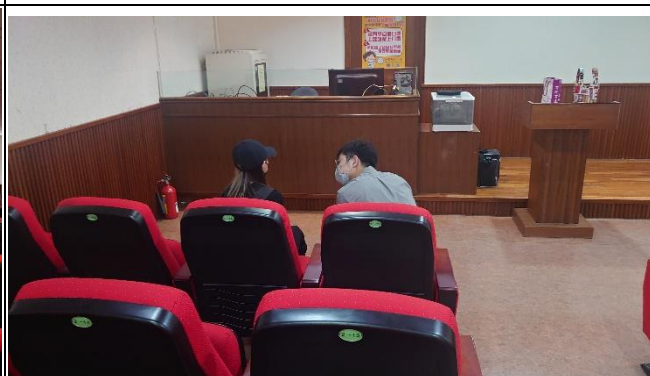
【陳醫師回應學生一對一提問】