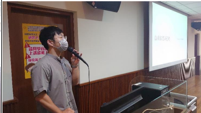
【講師陳醫師進行自殺防治守門人培訓課程】