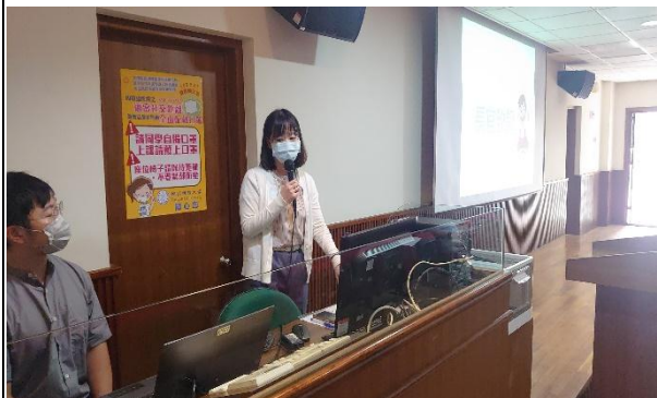
【陳社工師解說輔導股長業務及獎勵】