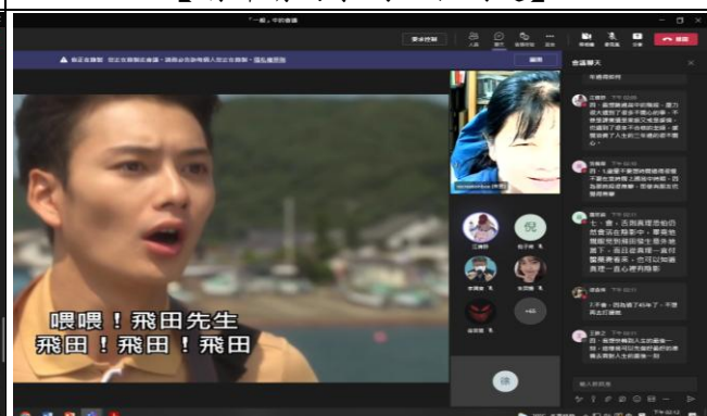
【學生分享自己的生命經驗】