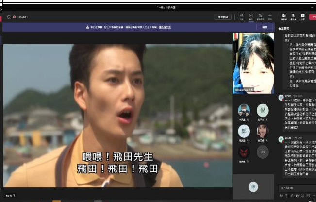
【講師請同學們回答問題】