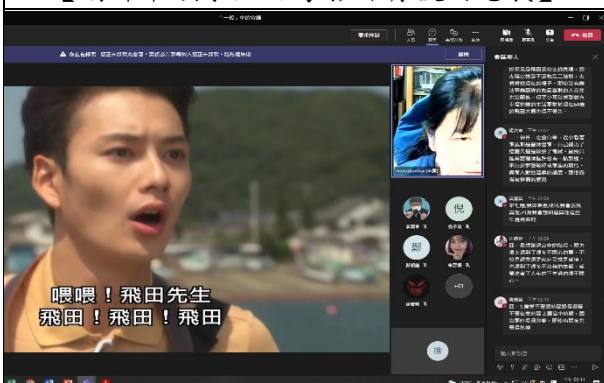
【學生踴躍回答老師的問題】