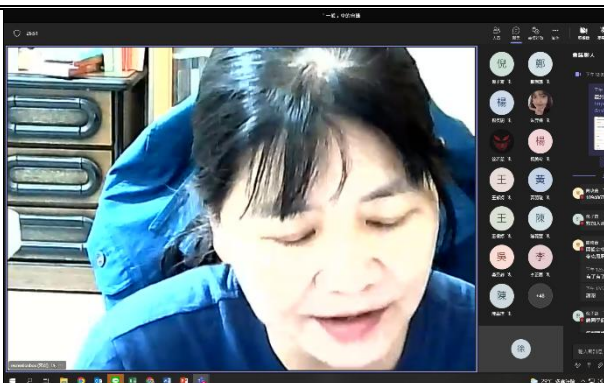
【講師開場介紹影片簡介】