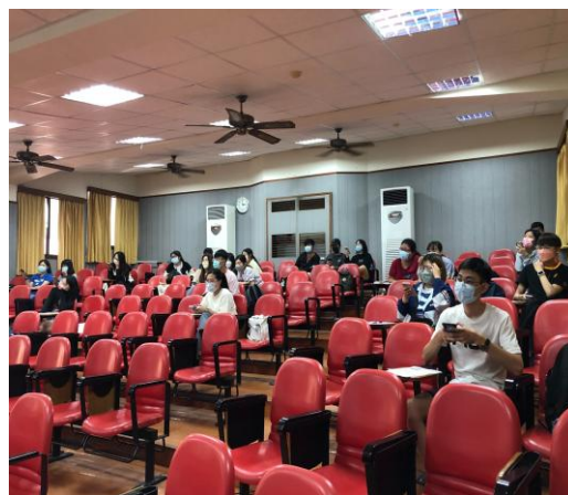
【學生專心聆聽講座】