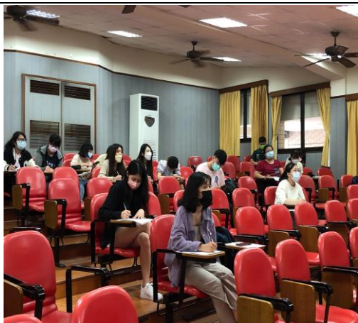
【學生專心聆聽講座】