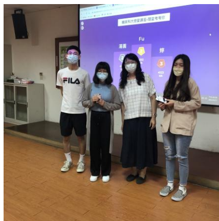
【講師致贈有獎徵答的禮物給獲選的學生】