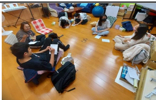
【實習心理師帶領團體成員相互認識】