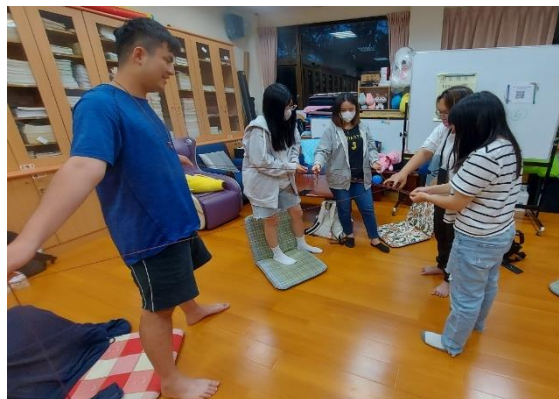
【團體成員活動交流討論】