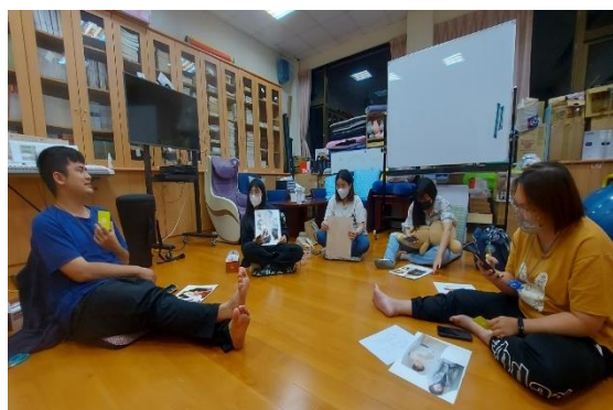
【團體成員進行分享】