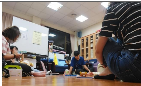
【實習心理師帶領團體進行】