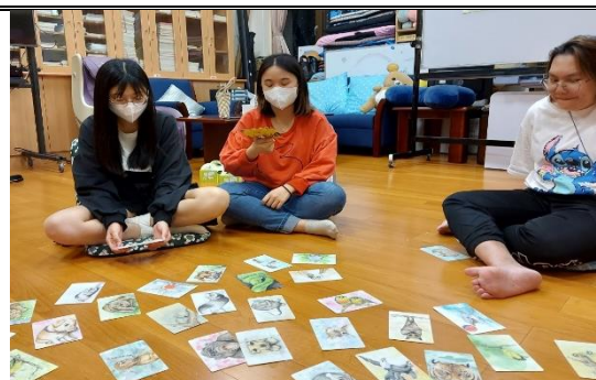
【團體成員挑選卡片】