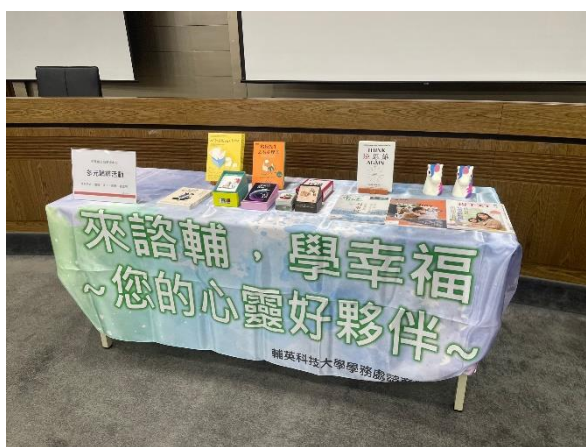
【結合輔導股長活動推廣多元輔導媒材】