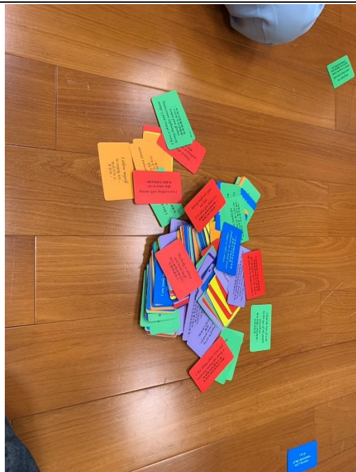
【成員挑選卡片祝福其他成員】