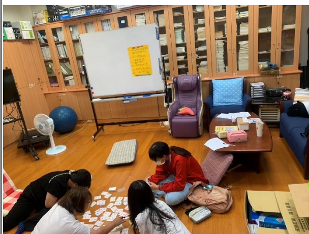
【成員彼此書寫討論內容】