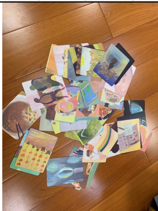
【成員想像對未來的憧憬並挑選牌卡】